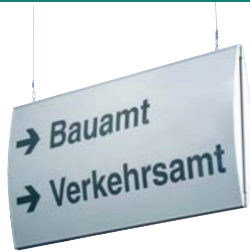
Hängeschild 2-seitig, Wölbung vertikal