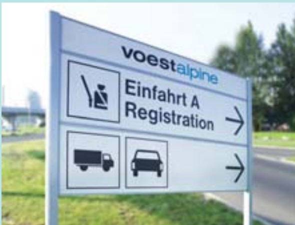
Außenbeschilderung Combiflex CF 40