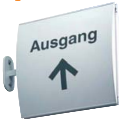
Fahnschild, Wölbung horizontal oder vertikal