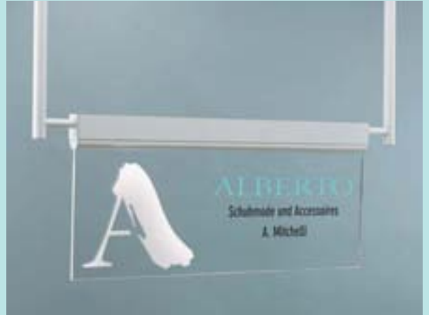
Innen- und kantenbeleuchtete Schilder CF 31