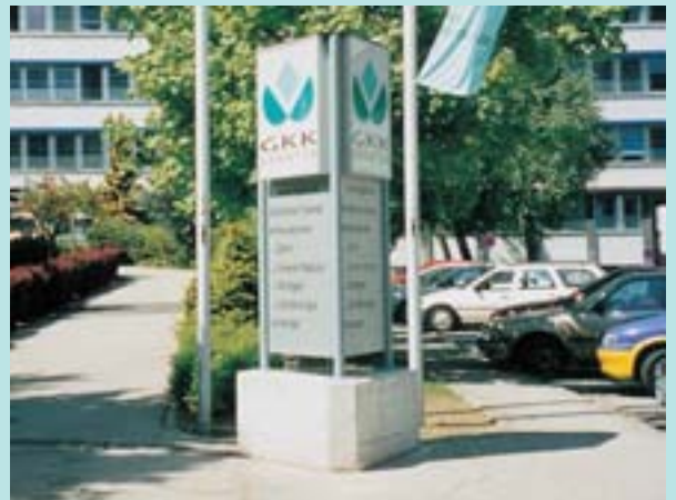
Innenbeleuchtete Werbeschilder Combiflex CF 50