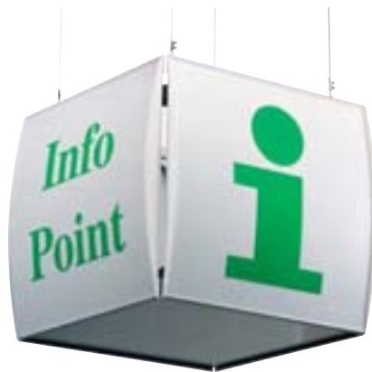
Hängeschild 4-seitig, Wölbung vertikal