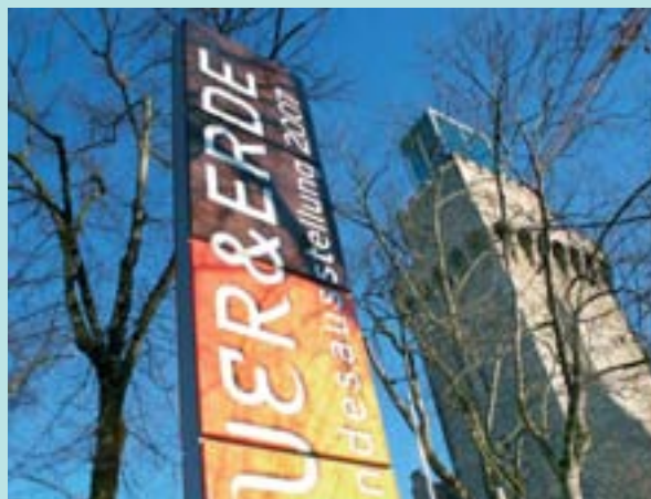
Außenbeschilderung Combiflex CF 60