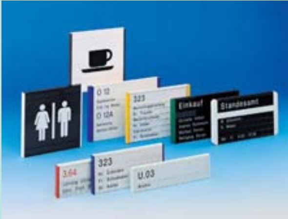
Innenbeschilderung Combiflex CF 10 / CF 20